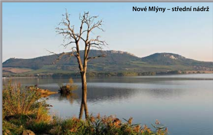
Nové Mlýny – střední nádrž