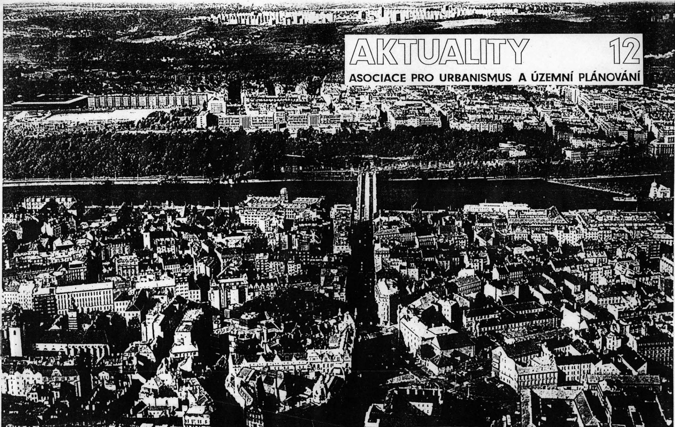
ÚZEMNÍ PLÁN HLAVNÍHO MĚSTA PRAHY • PRVNÍ ČTENÍ 1991 • ÚTVAR HLAVNÍHO ARCHITEKTA