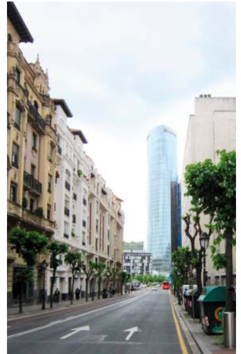
Iberdrola Tower (César Pelli, 2009–2012; výška 165 m)