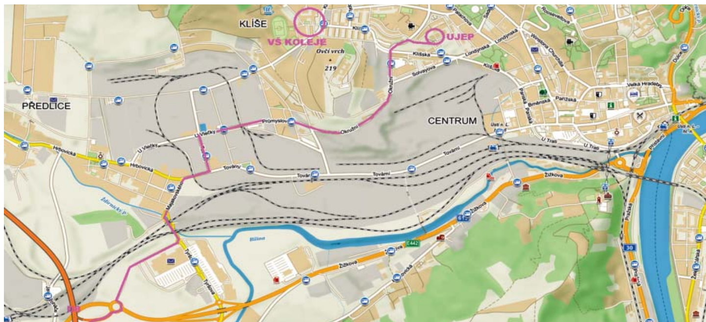
Místo konání konference – Budova MFC UJEP, Pasteurova 1

Ubytování: www.usti-nad-labem.cz . Koleje UJEP: ubytovani@ujep.cz ; tel.: 475 287 241 (objednávat pod heslem „konference AUÚP“).