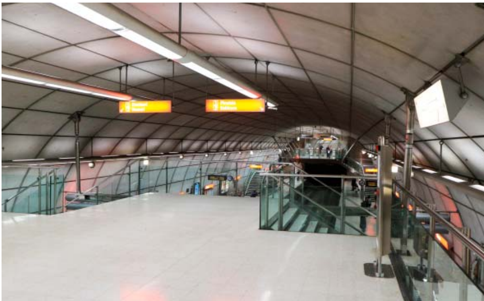
Metro (Norman Foster, 1995)

tách navrženo velké množství parků a veřejných prostranství. Za klíč k úspěchu velkých projektů je považováno fungování veřejné developerské společnosti Bilbao Ria 2000. Ve společnosti měly nadpoloviční finanční účast stát a region skrze vlastnictví podniků, které v lokalitách působily. Ekonomický model společnosti byl založen na revolvingovém principu, kdy veškeré zisky z pozemků zhodnocených plánováním, výstavbou infrastruktury a následným prodejem investorům, musely být reinvestovány do dalšího rozvoje vybraných lokalit. Výstavba a provoz Guggenheimova muzea se pro samotné iniciátory projektu staly překvapením, neboť málokdo počítal s návratností investic během 8 let od otevření muzea a s návštěvností kolem 1 milionu návštěvníků ročně. Podle analýz se