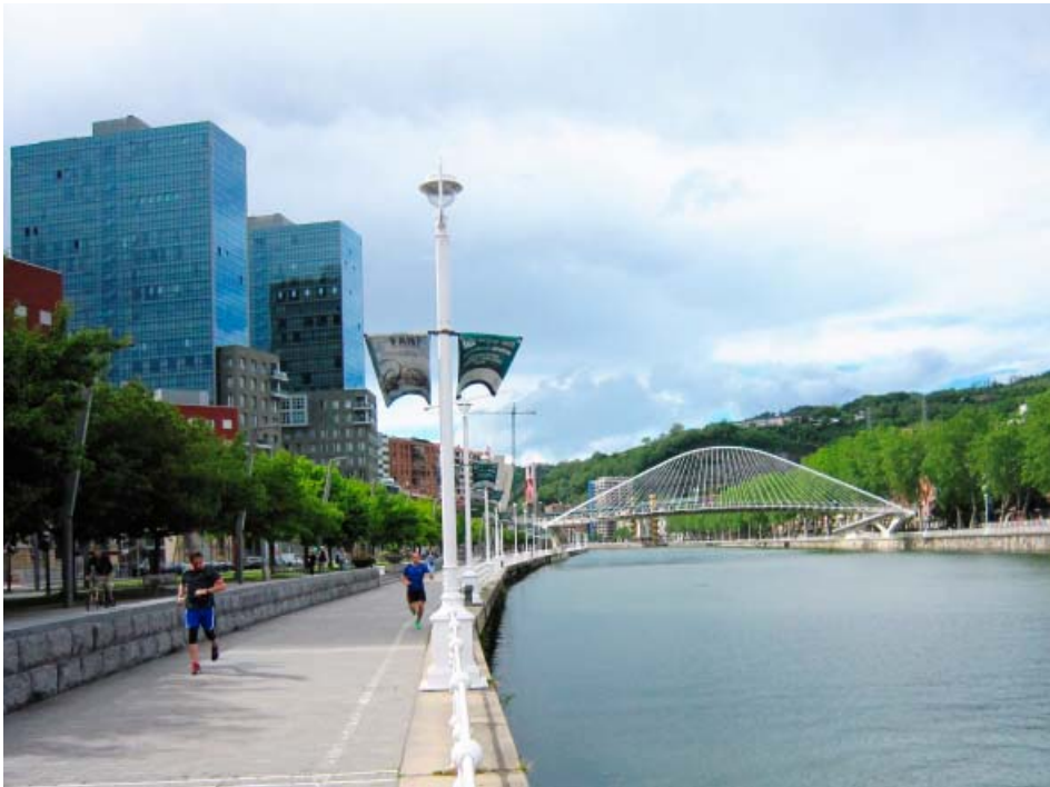
Zubizuri – most pro pěší (Santiago Calatrava, 1997)