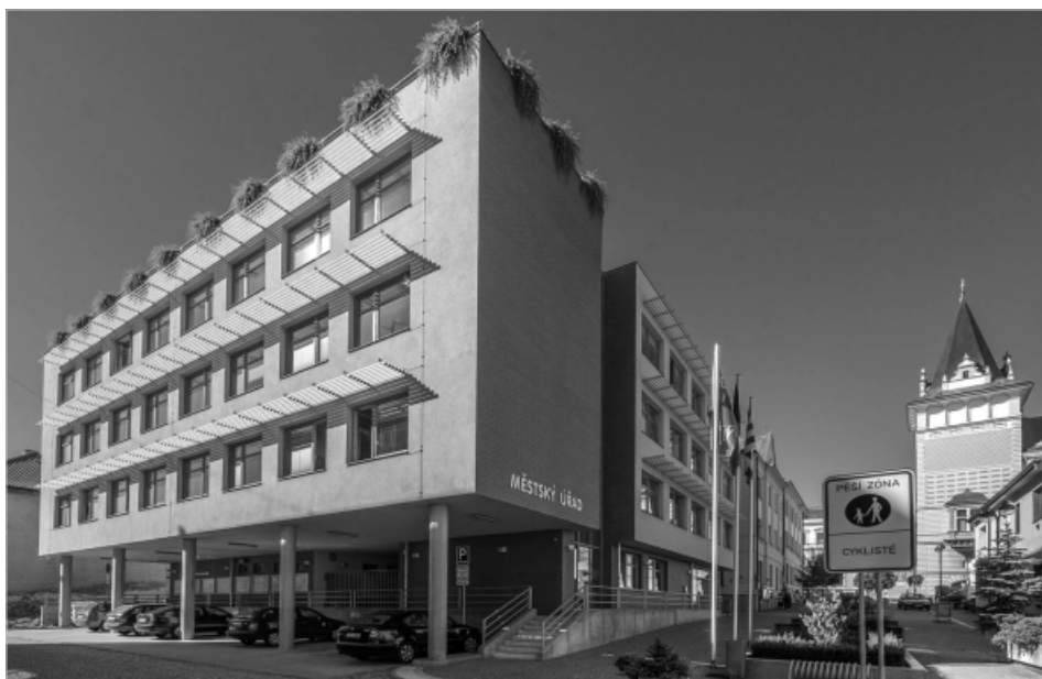
Budova městského úřadu v Pílelouči nahradila v roce 2012 nevyhovující starou radnici na náměstí a vyplnila do té doby nezastavěný pozemek v centru města

V roce 1993 se úspěšně účastní konkurzu na výkon funkce městského architekta pro město Vysoké Mýto. Tuto prospěšnou činnost vykonává doposud formou externí spolupráce. V roce 2000 odchází z Ateliéru Aurum a zakládá vlastní Ateliér ArchiKo. Důvodem tohoto rozhodnutí je snaha vytvořit si více prostoru pro vlastní architektonickou tvorbu na nejvyšší úrovni a specialistům v původní firmě umožnit orientaci výhradně na zpracovávání územních plánů. Jak se záhy ukázalo, bylo toto rozhodnutí velmi prozíravé.