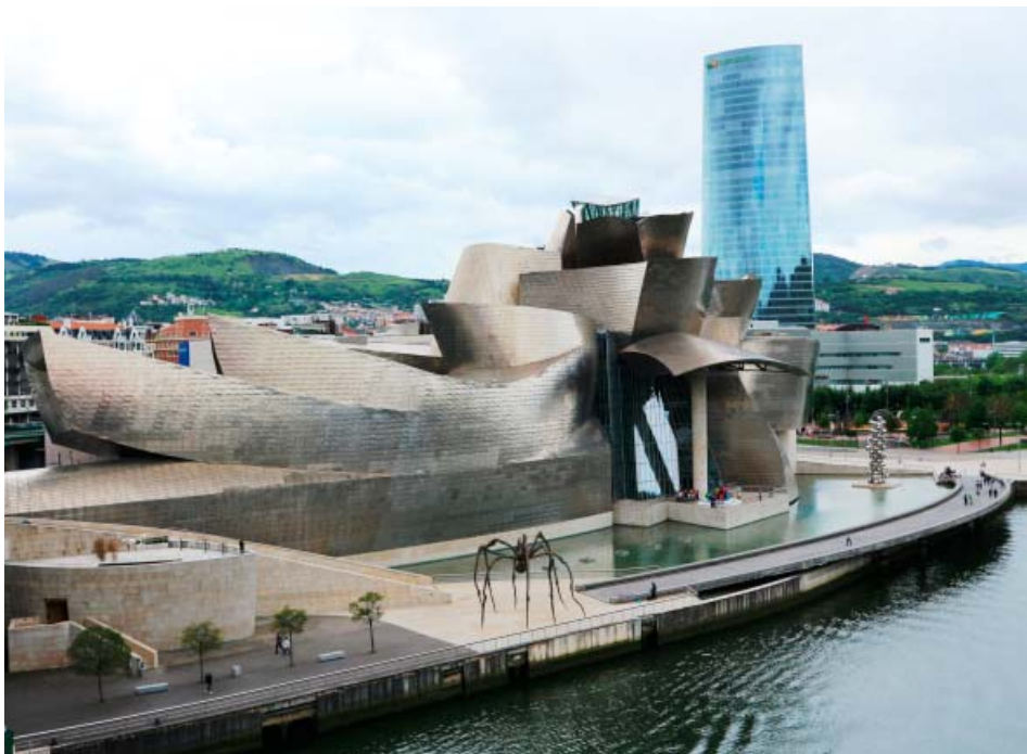
Guggenheimovo muzeum (Frank O. Gehry, 1992–1997)

Úspěch nového rozvoje Bilbao závisel na naplnění několika podmínek, které byly v daný historický moment ojedinělé: Bilbao prožívalo vrchol ekonomické krize způsobené úpadkem průmyslové výroby a s ní souvisejících činností až počátkem 90. let díky předchozí ochranářské hospodářské politice Frankova režimu. V roce 1986 se Španělsko stalo členem Evropské unie a ve stejné době se formovalo nové regionální uspořádání země. Baskicku se podařilo vyjednat výborné podmínky, když její provincie získaly jako jediné i fiskální autonomii. Do vedení města se počátkem 80. let postavili politici, místní patrioté, s vazbami na státní a regionální politiky a domácí velké podniky, jejichž společným zájmem byla transformace města a vybudování nové ekonomické základny. Potřebu razantně a rychle zahájit nový rozvoj urychlily následky záplav z roku 1983, záplavy, které podobně jako v Praze mobi-