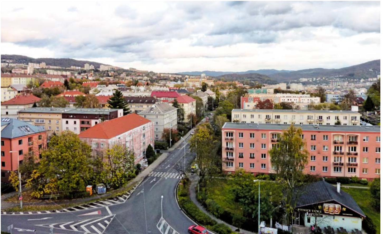
Výhled na město z 11. podlaží vysokoškolských kolejí

omezené). Takovýto vrchol se pak obvykle projeví i přílivem do spolkové pokladny. V posledních letech to, pravda, trochu vážně, ale ústecká konference se opravdu dostala na samu hranu – a to ale teď nemluvíme o saldu, finální sčot možná ještě ani nebyl dokončen, ale mluvím o počtu přítomných. Však to bylo poprvé, kdy shromáždění členů nebylo schopné usnášení.