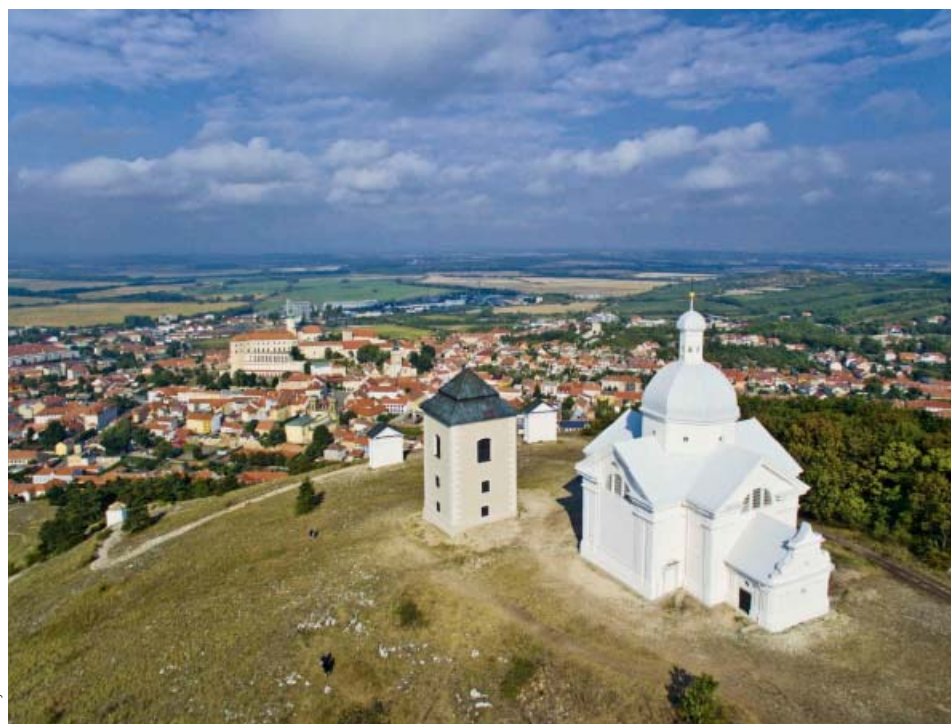
Svatý kopeček u Mikulova s poutní kaplí sv. Šebestiána schválila vláda ČR v lednu 2018 za národní kulturní památku