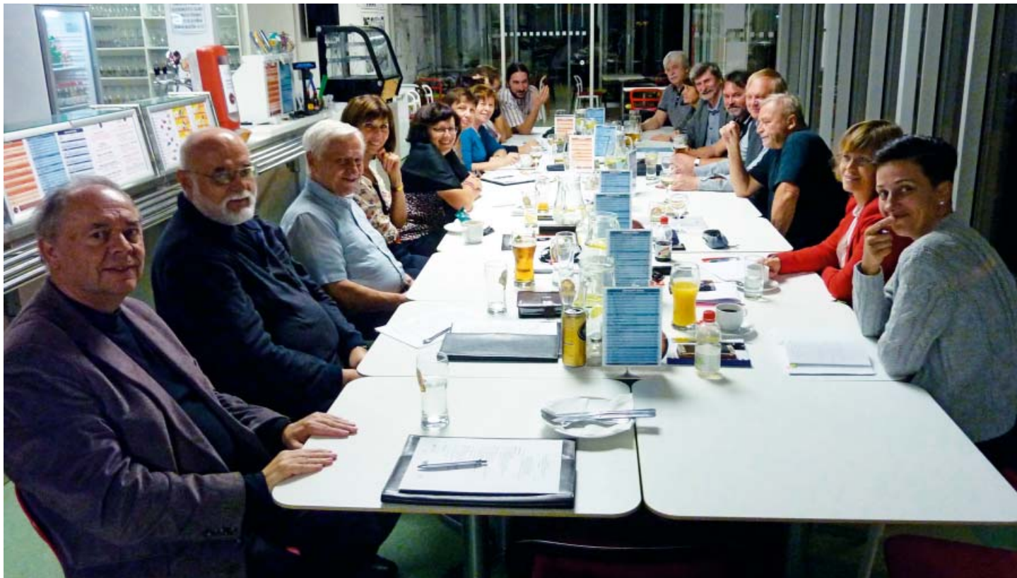
Rada Asociace v předvečer konference se sice usmívá, ale už podle počtu přihlášených členů tuší problém: usnášeníschopnost shromáždění členů je na vážkách...

noviskem úřad územního plánování – nově to dotčený orgán, o veřejných zájmech, které stavební zákon hájí, o cílech a úkolech územního plánování, o zkrácených postupech, díky nimž se notně prodloužil stavební zákon, o hasičích, o vedení 400 kV, strojově čitelném formátu, o prvcích regulačního plánu, webu a úplném znění a o mnohém dalším. To všechno se dočtete ve vyčerpávacích pasážích stavebního zákona a vyhlášek, ale některé souvislosti vám možná uniknou – a tak nezbyvá než se těšit na tradiční společné „školení“ projektantů v Národním domě na pražských Vinohradech. Snad zase bude.