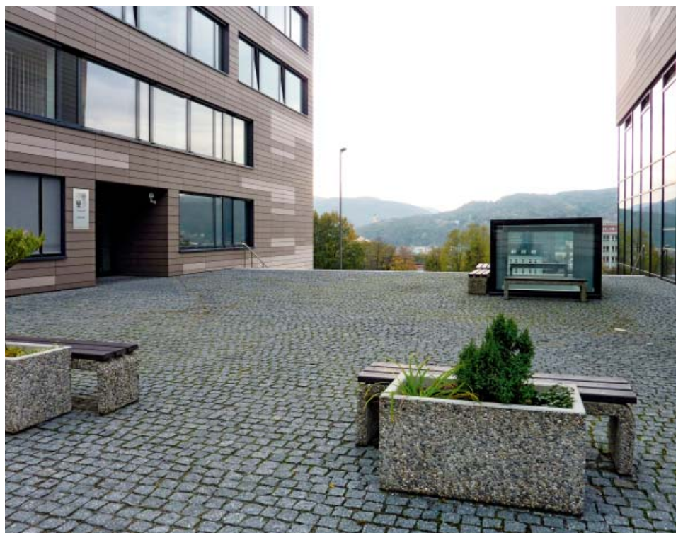
Výhled na město z piazzetty vysokoškolského kampusu