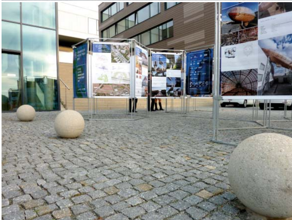
Kampus ústecké univerzity, místo konání konference a výstava Stavby roku tradičně v blízkém plenéru