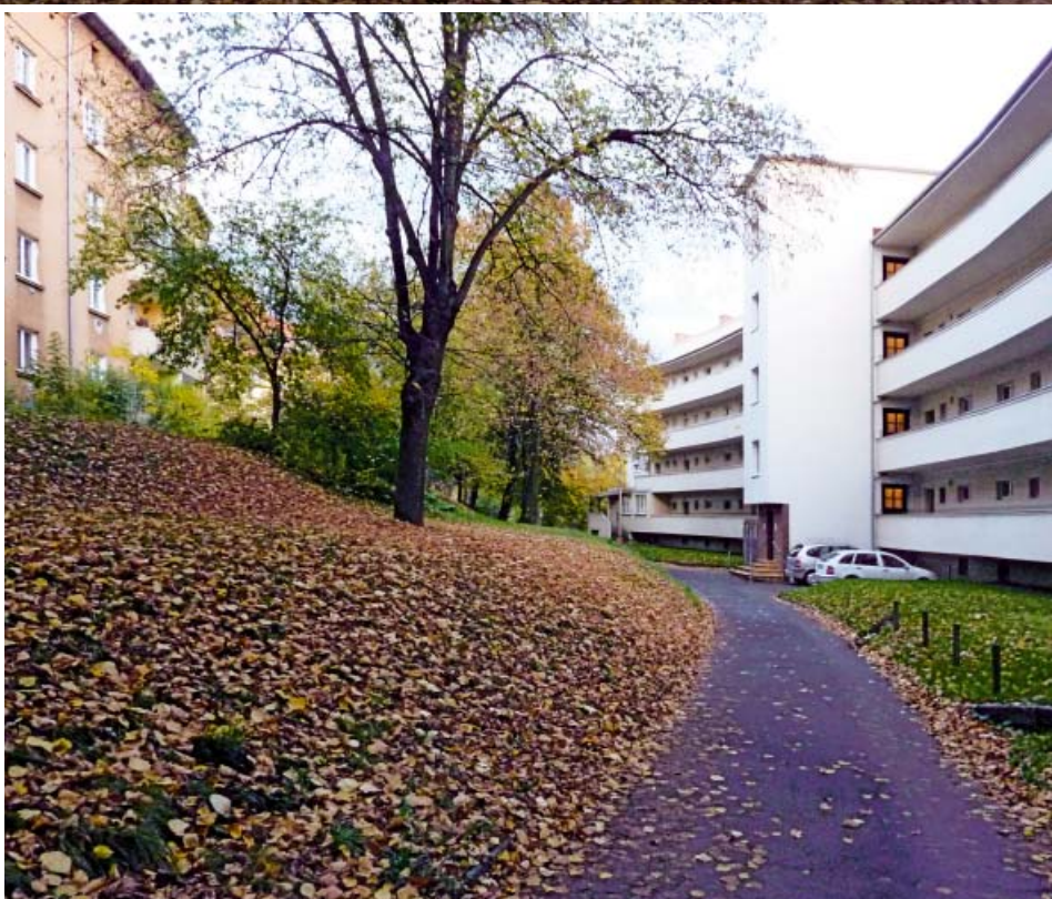
Na cestě mezi kolejemi a kampusem stojí S-domy architekta Franze Josefa Arnolda z počátku 30. let minulého století

Po teoretičtější pojetém vystoupení následoval Hynek Gloser , který přiblížil proměnu brownfields Škoda na PZ Škoda (2004–17), největšího realizovaného brownfieldu u nás, který má rozlohu 200 ha. Z 94 % byla plocha zastavěna, plná železnic, proťatá dvěma silnicemi. Projekt regenerace si vyžádal masivní demolice, sanace, projekt na dvě desetiletí.