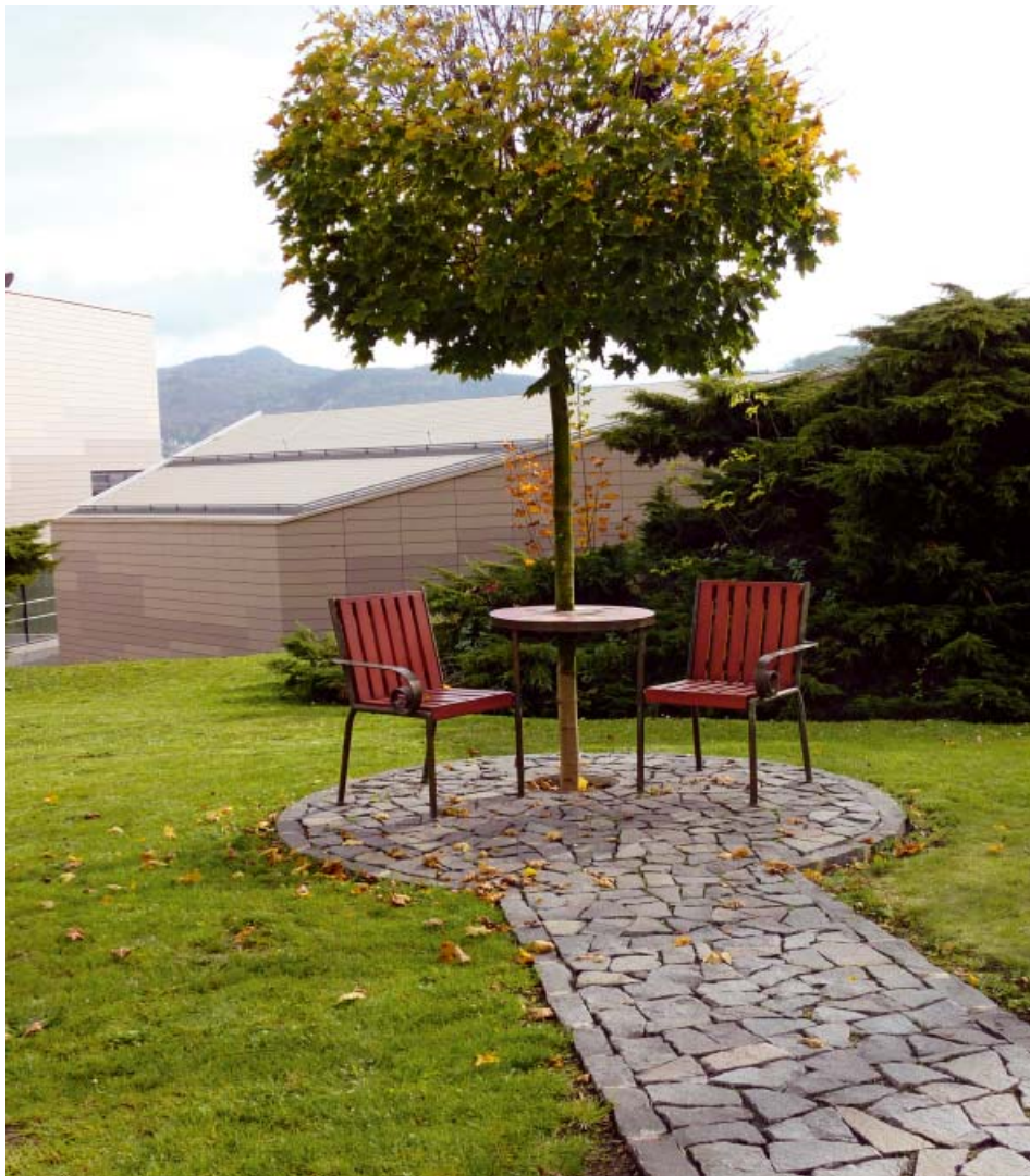
Ideální místo pro inspiraci, pro dva konferenci unavené urbanisty